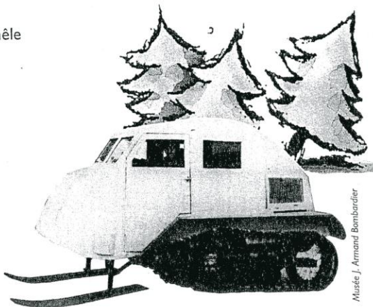
La B-7, fabriquée en 1936.

Aujourd'hui, les motoneiges sont utilisées dans les régions froides par les autochtones, les médecins, les policiers, les trappeurs, les mineurs, etc. Bien sûr, on fait aussi de la motoneige uniquement par plaisir.