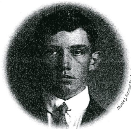
Musée J. Armand Bombardier